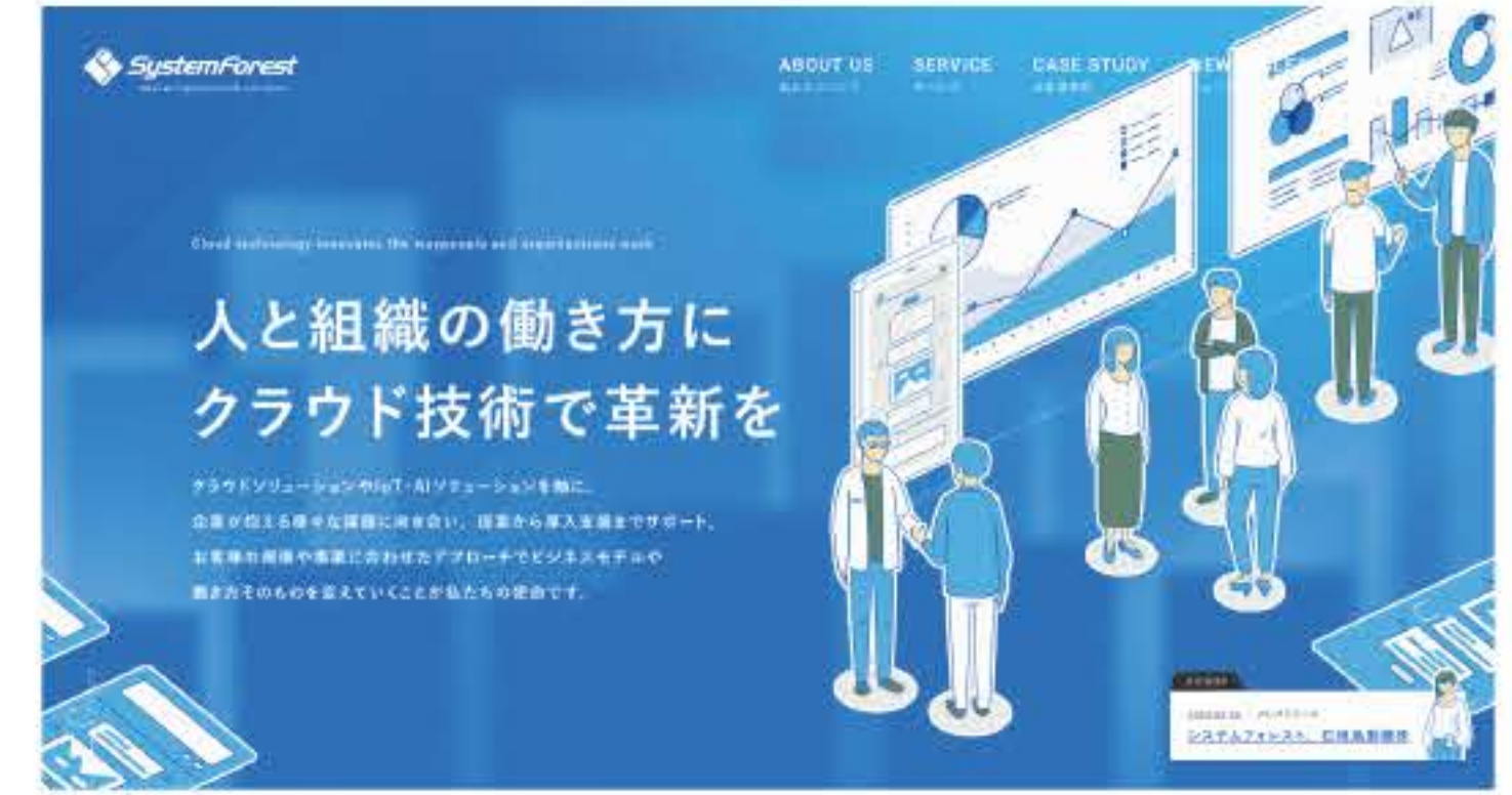
株式会社システムフォレスト https://www.systemforest.com/