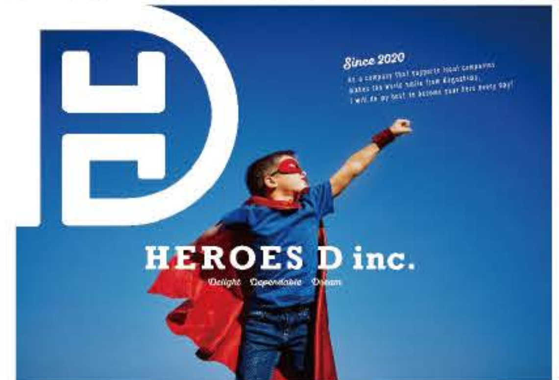
株式会社ヒーローズD

Dream:私たちは、一人一人が大きな夢を持ち、その夢に向かって歩きます。 https://heroes-design2006.business.site/